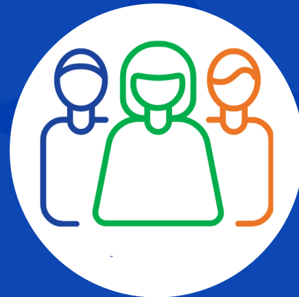
Работа с менеджерами