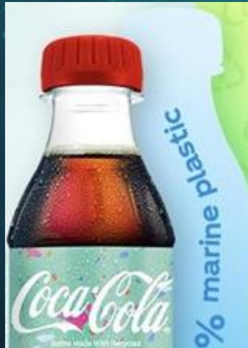
MARINE PLASTIC BOTTLE