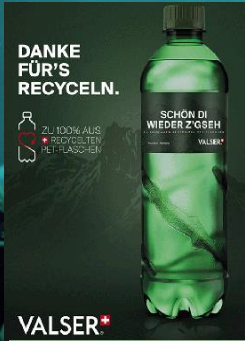
100% rPET BOTTLE