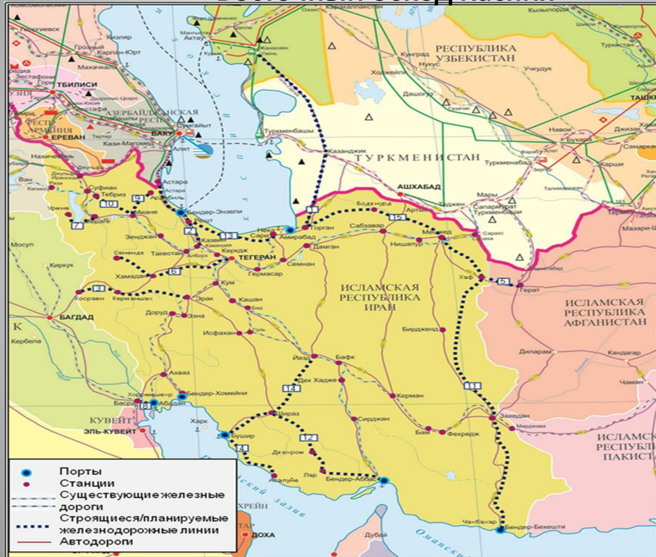
Схема железнодорожного маршрута по территории Ирана и Восточный обход Каспия